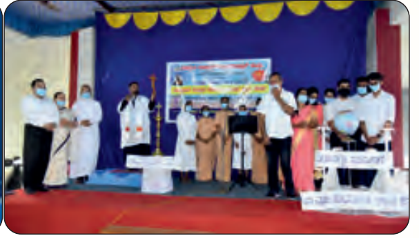
ಪಾತ್ರೋನ್ ಸಾಂತಾಕ್ ಮಾನ್ ಕರ್ನ್ ಗಾಯನ್ ಸ್ಪರ್ಧೊ