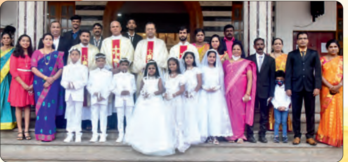
ಫಿರ್ಗಜೆಂತ್ ಪಯ್ಲಿ ಪಾವ್ಲಿ ಕ್ರಿಸ್ತ್ ಪ್ರಸಾದ್ ಸೆವ್ತುಲ್ಲಿಂ ನೆಣ್ಣೆಂ