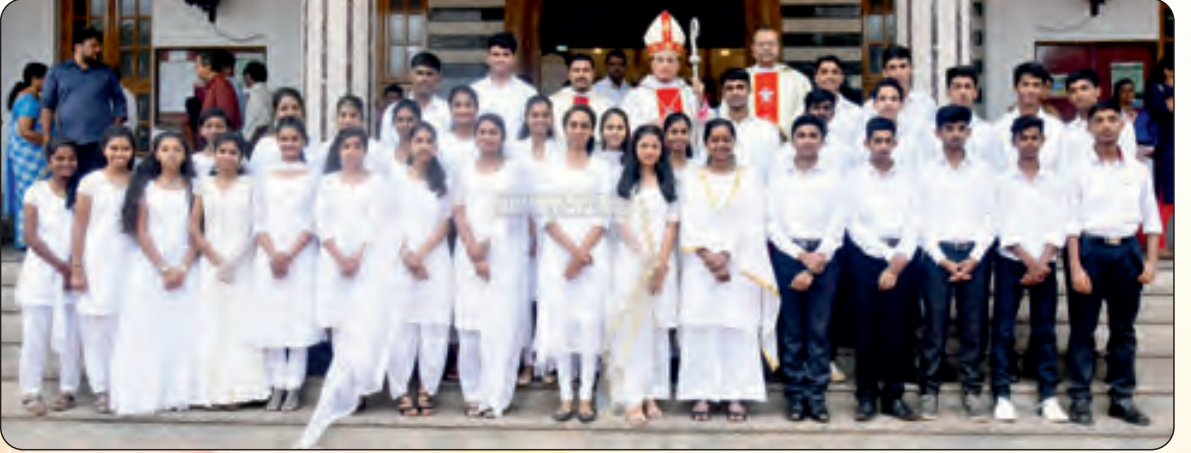
ಫಿರ್ಗಜೆಂತ್ ಥಿರಾವ್ಣಿ ಸಾಕ್ರಾಮೆಂತ್ ಘೆತುಲ್ಲಿಂ ಯುವಜಣಾಂ