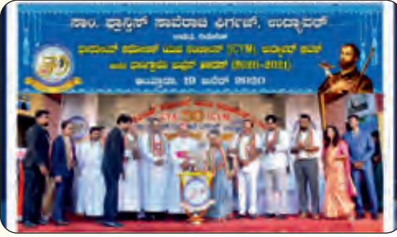
ಭಾರತೀಯ ಕಥೋಲಿಕ್ ಯುವ ಸಂಚಾಲನ ಭಾಗ್ಯಕ್ರೋ ಜುಜ್ಜೆವ್ ಉದ್ಘಾಟನೆ ಕಾರ್ಯಂ